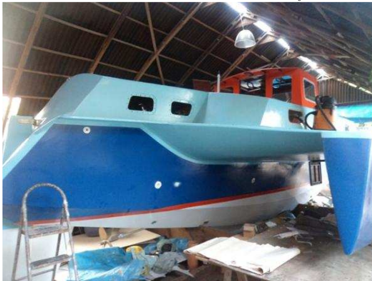
Barco no quintal em fase acabamento

O veleiro Aragem, que possui 11 metros, foi içado na manhã desta sexta-feira (20) por dois