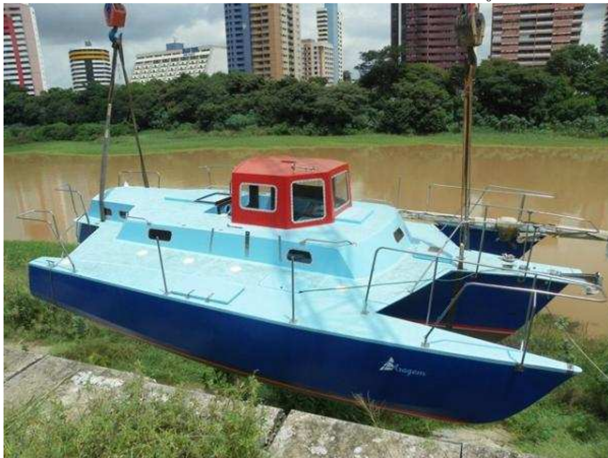
Barco sendo içado